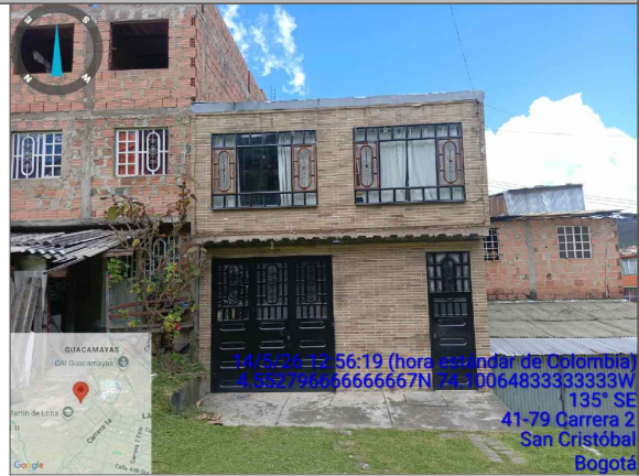
VISTA FRONTAL PREDIO