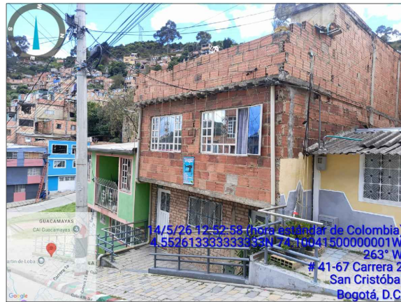
VISTA LATERAL DERECHA PREDIO