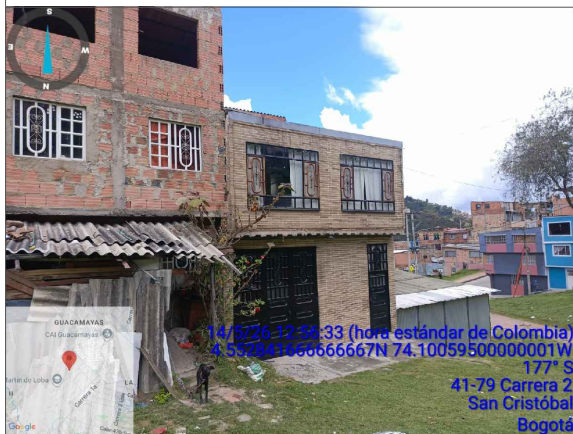
VISTA LATERAL IZQUIERDA PREDIO