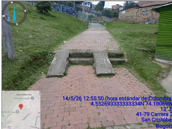
RAMPA EN EL ESPACIO PÚBLICO