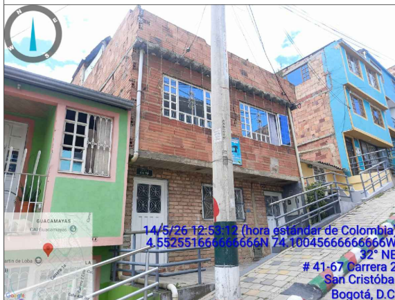
VISTA LATERAL IZQUIERDA PREDIO