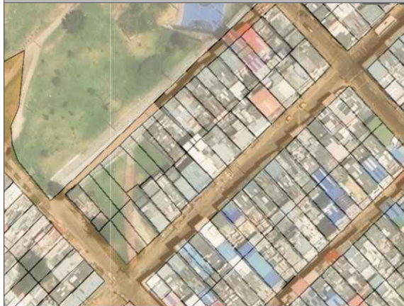
LOCALIZACIÓN: (CARRERA 2 # 41 - 79 SUR)