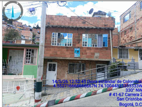
VISTA FRONTAL PREDIO