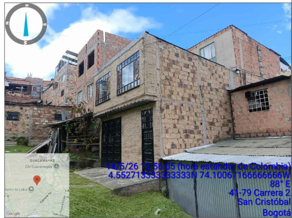
VISTA LATERAL DERECHA PREDIO

Fundamentalmente, el arquitecto adscrito a la Inspección 4B Distrital de Policía, de la Localidad de San Cristóbal, Mauricio René Osorio Useche realiza la visita técnica del expediente No. 2017543870100150E, Presentandose en el lugar que corresponde a la dirección con nomenclatura (CARRERA 2 # 41 - 79 SUR / BARRIO : SAN MARTÍN DE LA LOBA / UPL 21 SAN CRISTÓBAL / TRATAMIENTO: MEJORAMIENTO INTEGRAL / AREA DE ACTIVIDAD PROXIMIDAD - AAP - RECEPTORA DE SOPORTES URBANOS)